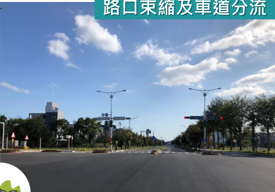
路口束縮及車道分流