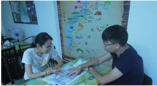
訪談民宿業者與居民